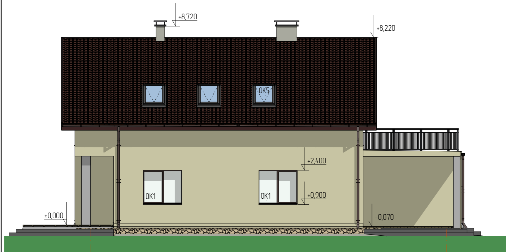
Фасад в осях "5-1"